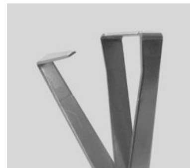
Blade of Triangle Scissors