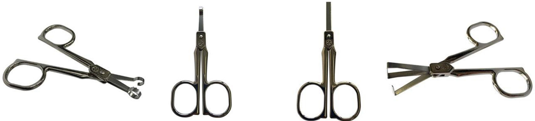
Oval Safety Scissors